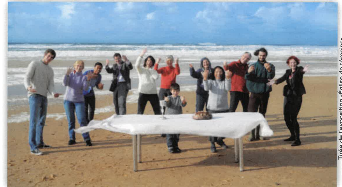
Thème de l'exposition «Église de témoins» de l'Église Protestante Unie de France, 2013

Horaires d'ouverture au public : du mardi au vendredi de 9h30 à 11h30