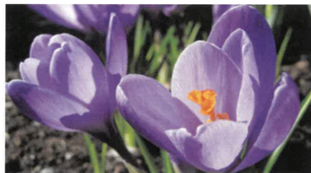
Tomas J. Stockholm Wikimedia