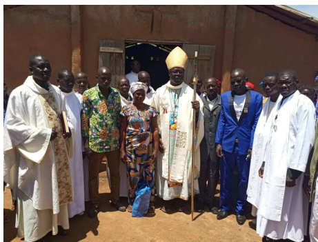
Visite pastorale à Notre-Dame de l'Ouhan