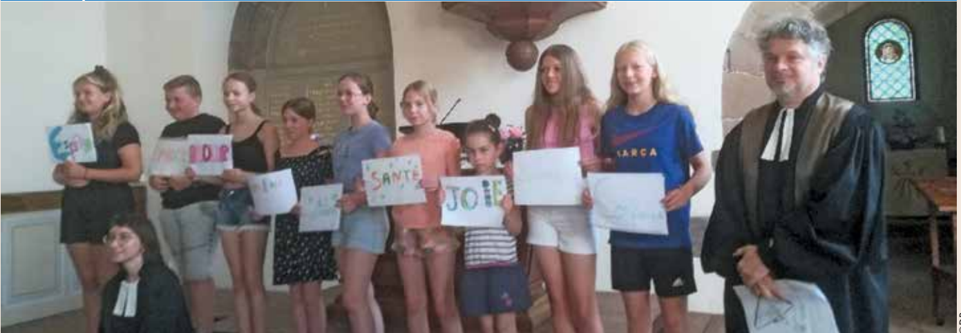
Le dimanche 25 juin a eu lieu le culte de fin d'année des catéchumènes du secteur des paroisses de Brumath-Krautwiller, d'Eckwersheim et de Geudertheim sur le thème « Jésus marche à nos côtés ».