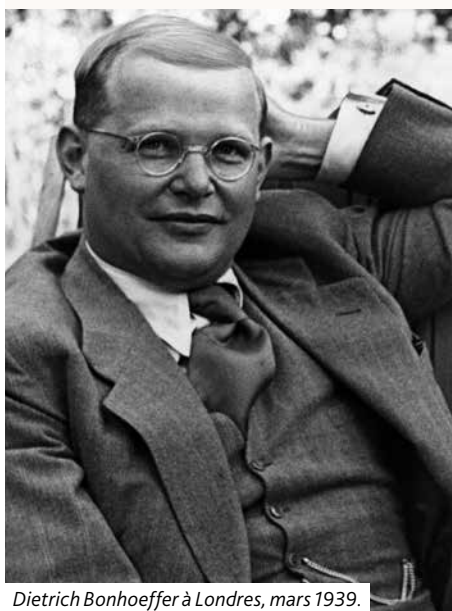
Dietrich Bonhoeffer à Londres, mars 1939.