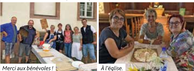
Merci aux bénévoles !

Notre fête d'été s'est déroulée le samedi 1 er juillet en fin de journée. Malheureusement, après 6 semaines de soleil ininterrompu, il a plu ce soir-là. Néanmoins,