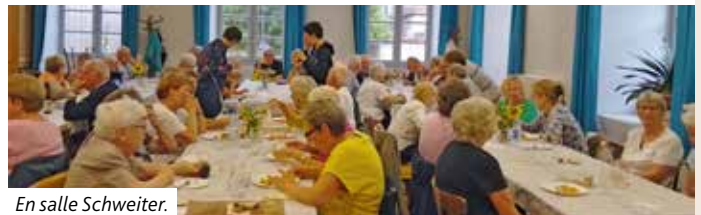
En salle Schweiter.

les paroissiens, qui se sont réfugiés à l'église et en salle Schweitzer, ont pu déguster les tartes flambées au sec. Un grand merci aux bénévoles !