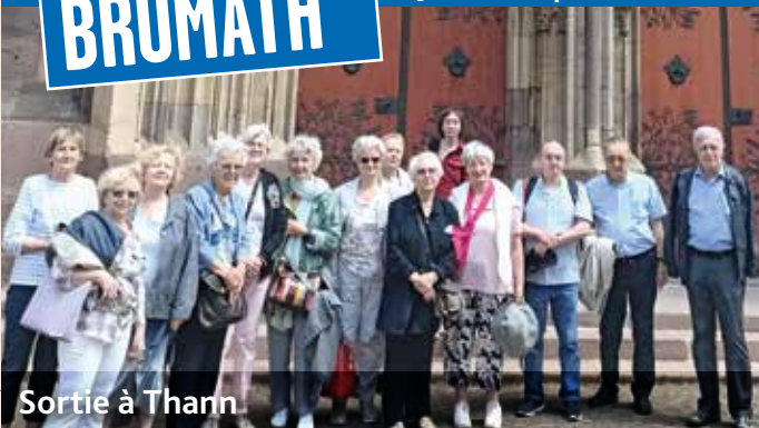
Sortie à Thann.

Le 4 juin dernier un petit groupe de paroissiens s'est rendu à Thann. C'était une belle journée conviviale, qui a commencé par un culte, s'est poursuivie par un repas pris en plein air, puis par la visite de la collégiale et du musée de Thann.