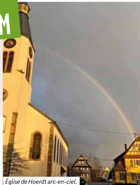
Église de Hoerd arc-en-ciel.

Les informations vous seront communiquées sous peu.