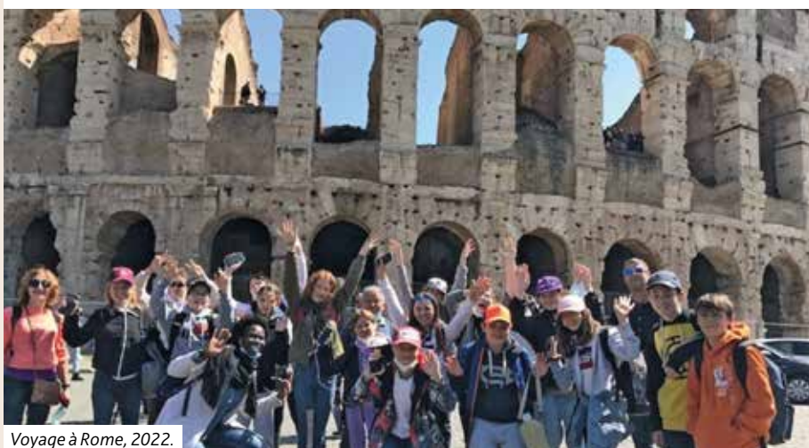
Voyage à Rome, 2022.

Les parents des jeunes nés en 2012 (ou plus tôt) et souhaitant que leur enfant suive le catéchisme sont invités à une réunion d'information qui se tiendra le 7 septembre à 20h à l'espace Heyler . Ce sera l'occasion de faire connaissance, rencontrer des membres de l'équipe qui anime le KT, présenter le programme et de répondre à vos questions. Cette réunion concerne aussi les parents des jeunes ayant déjà suivi une ou deux années de catéchisme.